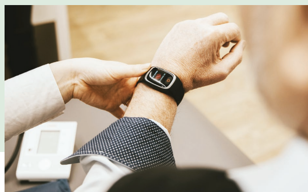
Opieka i monitoring zdrowia