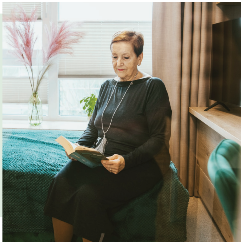
Zaspokojona potrzeba niezależności i samodzielności