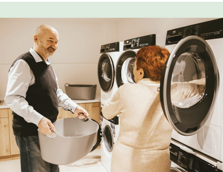
Bezpieczone i dopasowane do potrzeb środowisko