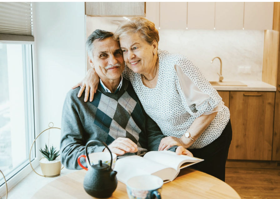
Poprawa jakości i komfortu życia